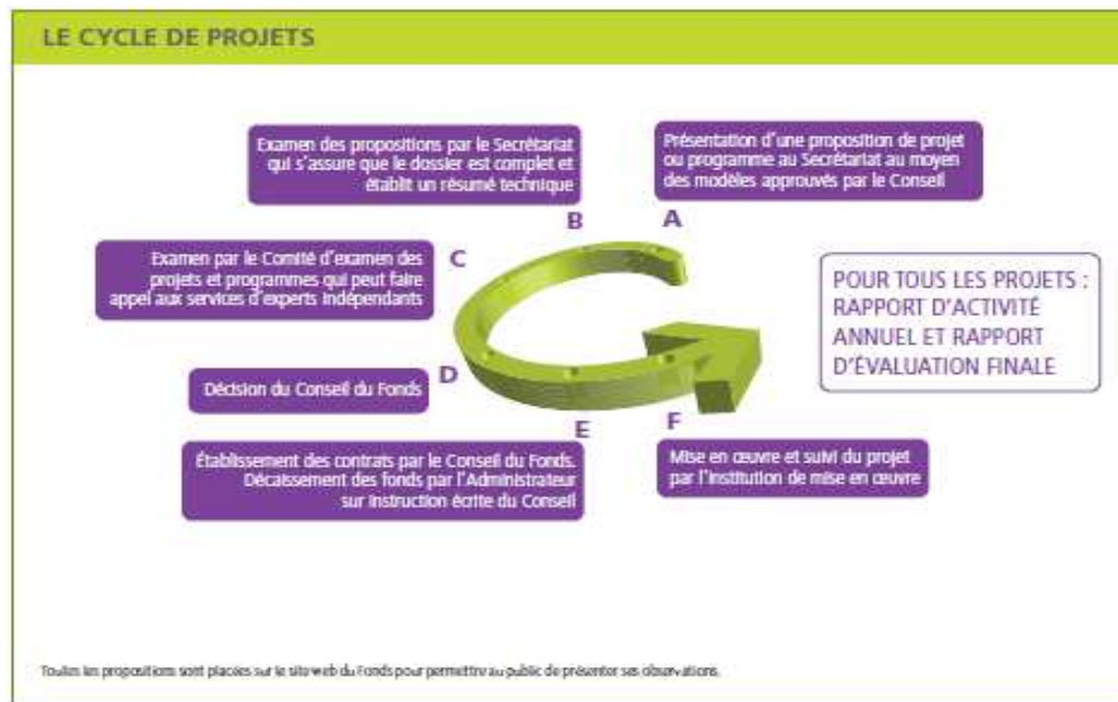
La figure 2 : Cycle de Projet du Fonds d'Adaptation